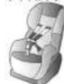
チャイルドシート